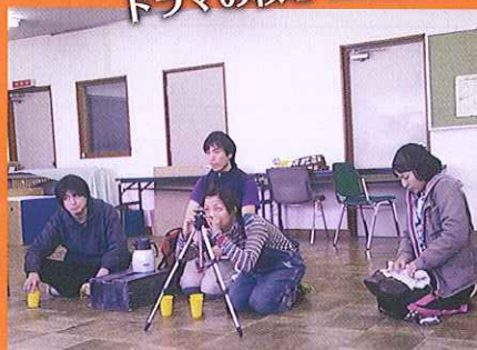
(東海講座・「アイソンの一夜」インプロシーン)