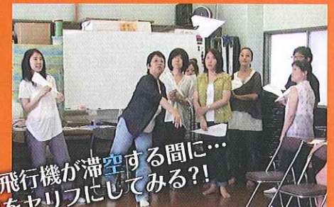
紙飛行機が滞空する間に… 夢をセリフにしてみる?! 劇作理論もワークショップを交えて