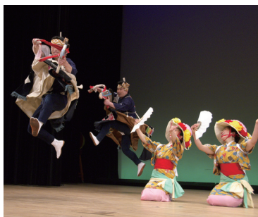
構成・演出／宮河伸行

“ラッセラー”の「荒馬踊り」、復興を願う「虎舞」、南の風を届ける「エイサー」…昔々から伝えられてきたお祭りの唄や太鼓や踊りで、子どもも大人も元気に！